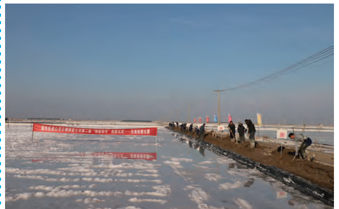
12月24日,灌西投资公司举办“薪火灌筑、匠星西传”第二届师徒结对擂台赛。本次擂台赛将举办师徒讲堂、电工技能、盐工技术、亮化美化等专项比拼,从说和做两个方面为产业工人提供展示技艺的舞台。(杨婕 许东彦)

“隐患大家找”拉响安全问题“警报器”。坚持开展“安全隐患大家找”职工性活动,激励职工聚焦人的不安全行为和物的不安全状态,发挥手机摄像头“终端监控”作用,随时随处查找记录工作环境中不安全因素,一键举报安全隐患,并要求相关单位按等级、紧急程度限期整改到位,强化整改后复查工作,确保隐患整改见时效、促长效。全年累计收到“安全隐患大家找”图片86张,评比表彰37人,激励更多职工争当排查安全隐患的“吹哨人”。(叶维友)