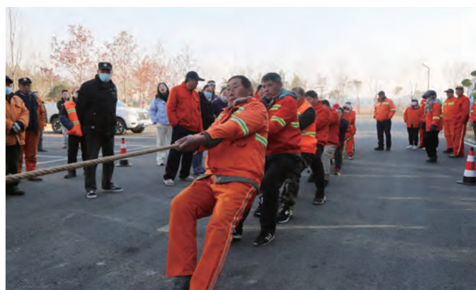
12月23-27日,台北(华茂)公司举办第五届职工“文体周”。本次文体周活动有男女混合拔河、同心击鼓、旱地划船、趣味接力、文艺演出等活动,进一步丰富职工文体生活,加强职工之间的交流与合作,增强公司向心力和凝聚力。(北工宣)

强化产改质效,创新创业齐头并进。 激发班组活力。班组“微课堂”开讲 30 多场次,班组长、技术骨干轮流上台,学习业务知识、交流管理经验,并开展“精读一本书”活动,提升班组整体素质。释放技能潜力。引领职工学知识、学理论、学技能,全年参与各类培训超 200 人次。圆满完成集团公司第四届职工技能大赛纤维板板块技能比赛承办工作,10 名职工分获一、二、三等奖,1 名职工荣获电工电焊比赛二等奖。彰显文化魅力。先后举办了“迎新春”职工趣味运动会、“庆三八”女职工素质提升系列活动,庆祝新中国成立 75 周年职工文体活动等。举办“青蓝悦享会”2 期,11 名职工分享工作经验。参与文明城市建设、义务献血等职工志愿服务活动近 80 人次。(刘媛媛)