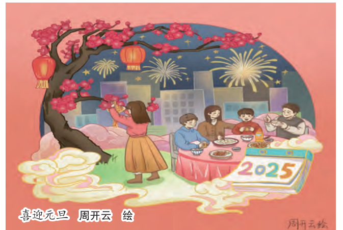
喜迎元旦 周开云 绘

不是所有的冬天都冷 一如不是所有的平庸都归结成一种中庸 不是所有的冬天都冷 一如不是所有的期待都幻化成一种梦境 不是所有的冬天都冷 勇于向前就没有跨不过去的险峰