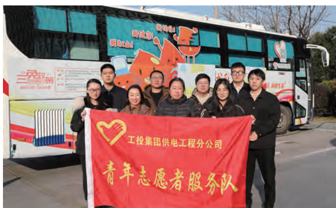
“热血”汇聚“暖流”!12月24日上午,供电工程分公司组织职工开展无偿献血活动,来自公司各条战线的20多名员工踊跃加入无偿献血行列,为连云港市临床用血奉献一份爱心。(郑 皓)